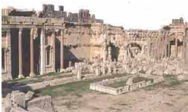
Templo de Júpiter